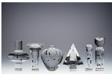
TAKT PROJECT 《COMPOSITION》