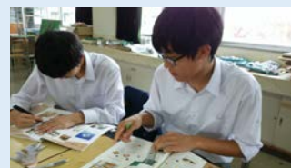
富山県立富山西高等学校