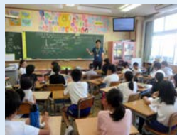
富山市立宮野小学校

アーティストとのコラボを特別に小学校と高等学校の2校で実施。小学生と高校生が、アーティストが関わることによってどのような作品を制作するのか楽しみなところです。また、出品校も通常7校のところ、希望多数により、今回8校に。子どもたちの個性あふれる作品を紹介します(各校からの出題クイズを解きながら楽しく鑑賞いただきます)。