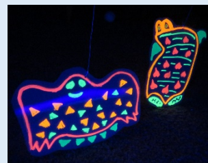
オープンラボ「空飛ぶ生きものを作ろう」参考画像

「みる・つくる・発表する」を今回も実施。さらに前回から規模も点数もパワーアップさせ、出品校以外の多くの子どもたちが制作した千点以上の作品も紹介します(プレワークショップ制作者46名、アーティスト企画によるオープンラボ制作者1,006名、初日のアーティストによるワークショップ作品・富山城の天守閣も定員20名で実施予定)。会場では家族や友だちとみんな一緒に探検してもらいます!