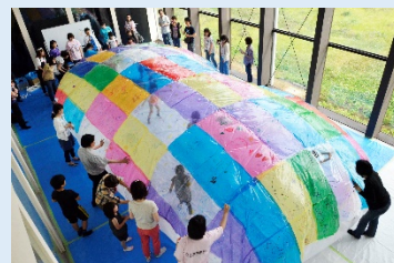
カラードーム参考画像

前回展では、展示室 3 および 4 の 2 室で開催していた本展ですが、今回は新たに展示室 2 をプラスして無料の創作・体験空間としました。巨大カラードームに入って遊んだり、ワークショップに参加したり、楽しい創作・体験プログラムを実施。土日祝日には「スペシャルパーティータイム」として、約 15 分、会場を暗転させる予定にしています。いつもと違う空間で色とりどりに光り輝く作品を見ていただきます。