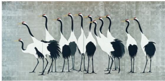
加山又造《群鶴図》1988年 キリンホールディングス株式会社蔵