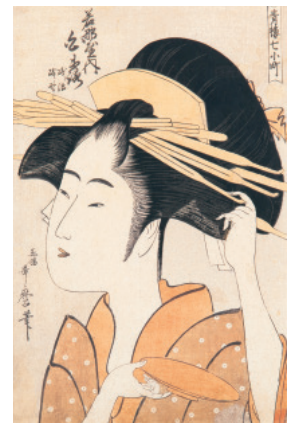
喜多川歌麿 青樓七小町《若部屋内白露》江戸時代 光ミュージアム蔵(前期展示)