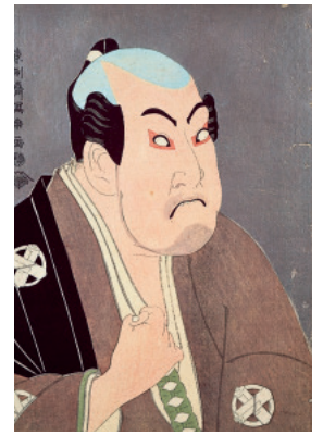
東洲斎写楽(谷村虎蔵の賢塚八平次)江戸時代 公益財団法人 平木浮世絵財団蔵(10/10-10/20展示)