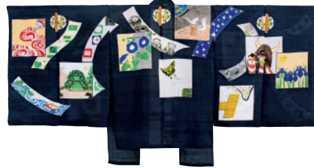
山本太郎《狂言花子用養襦三世茂山千之丞 ver.》2018年 茂山千之丞氏蔵