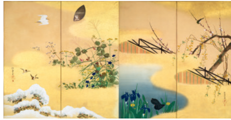
酒井抱一《四季花鳥図》江戸時代 京都国立博物館蔵(前期展示)

本展では、日本の美術にみる装飾性・デザイン性に着目し、琳派、浮世絵版画から現代絵画、ポスターまで、その多様な美の様相を紹介します。