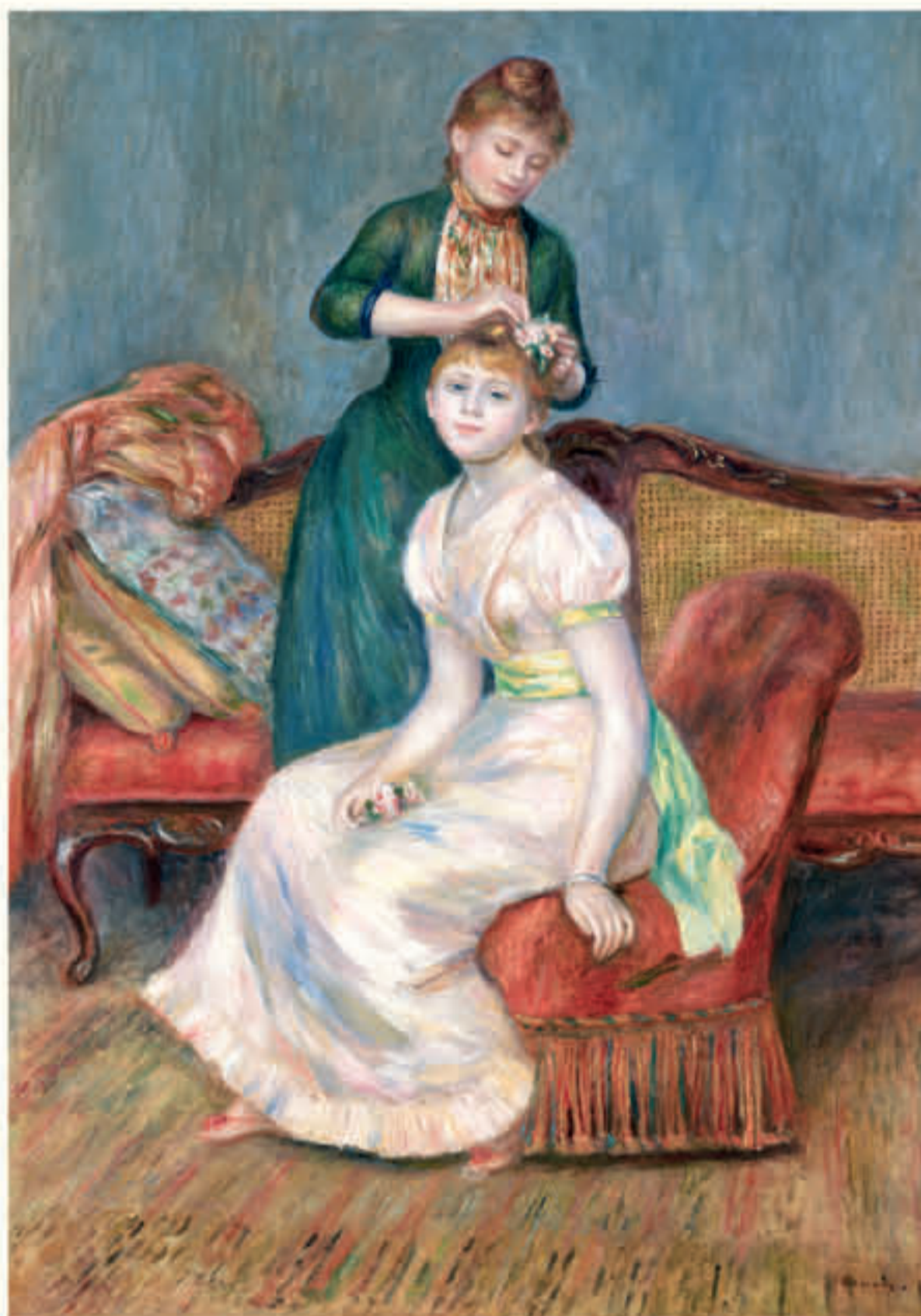
ピエール・オーギュスト・ルノワール 《髪かざり》1888年