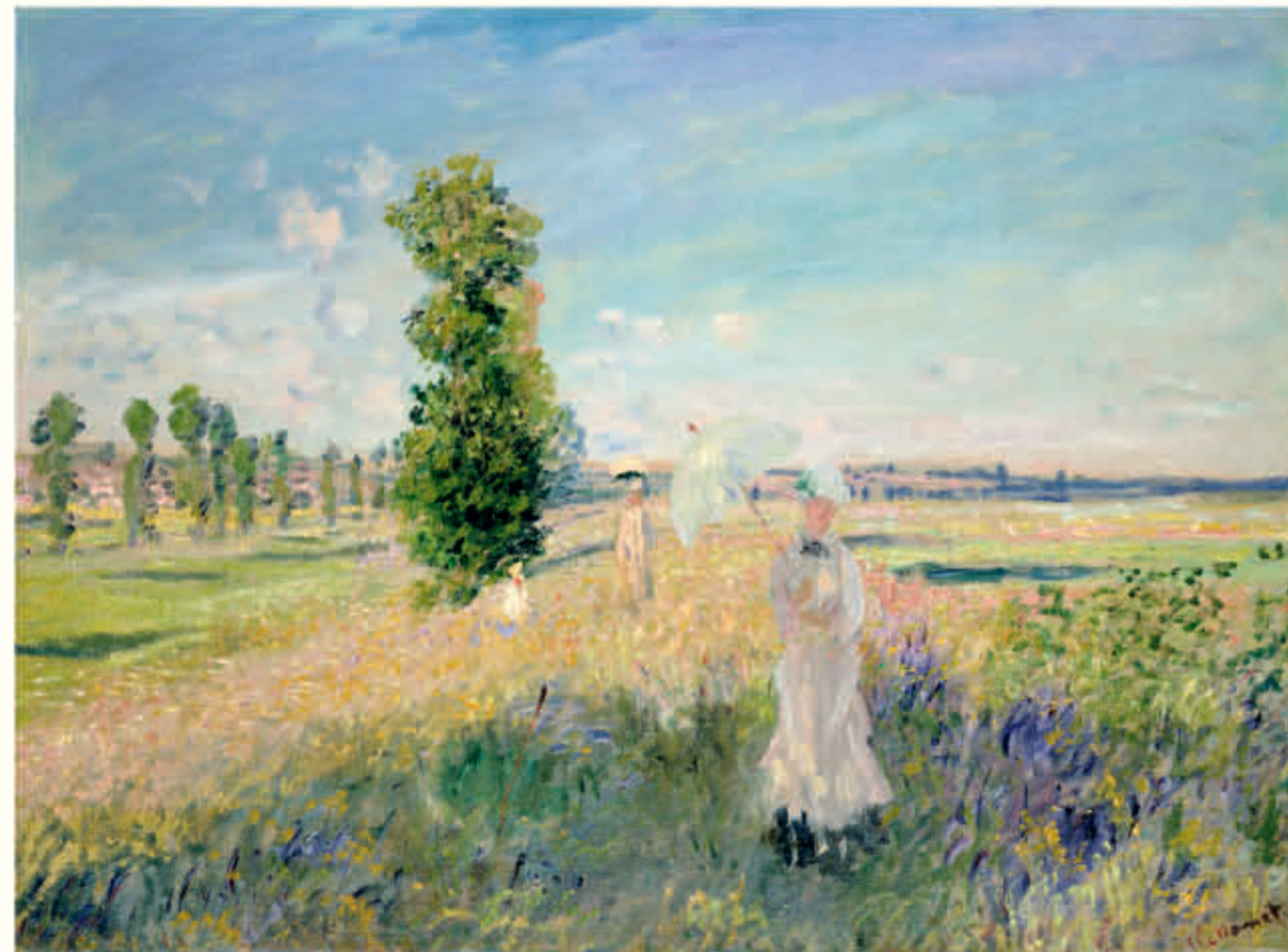
クロード・モネ《散歩》1875年