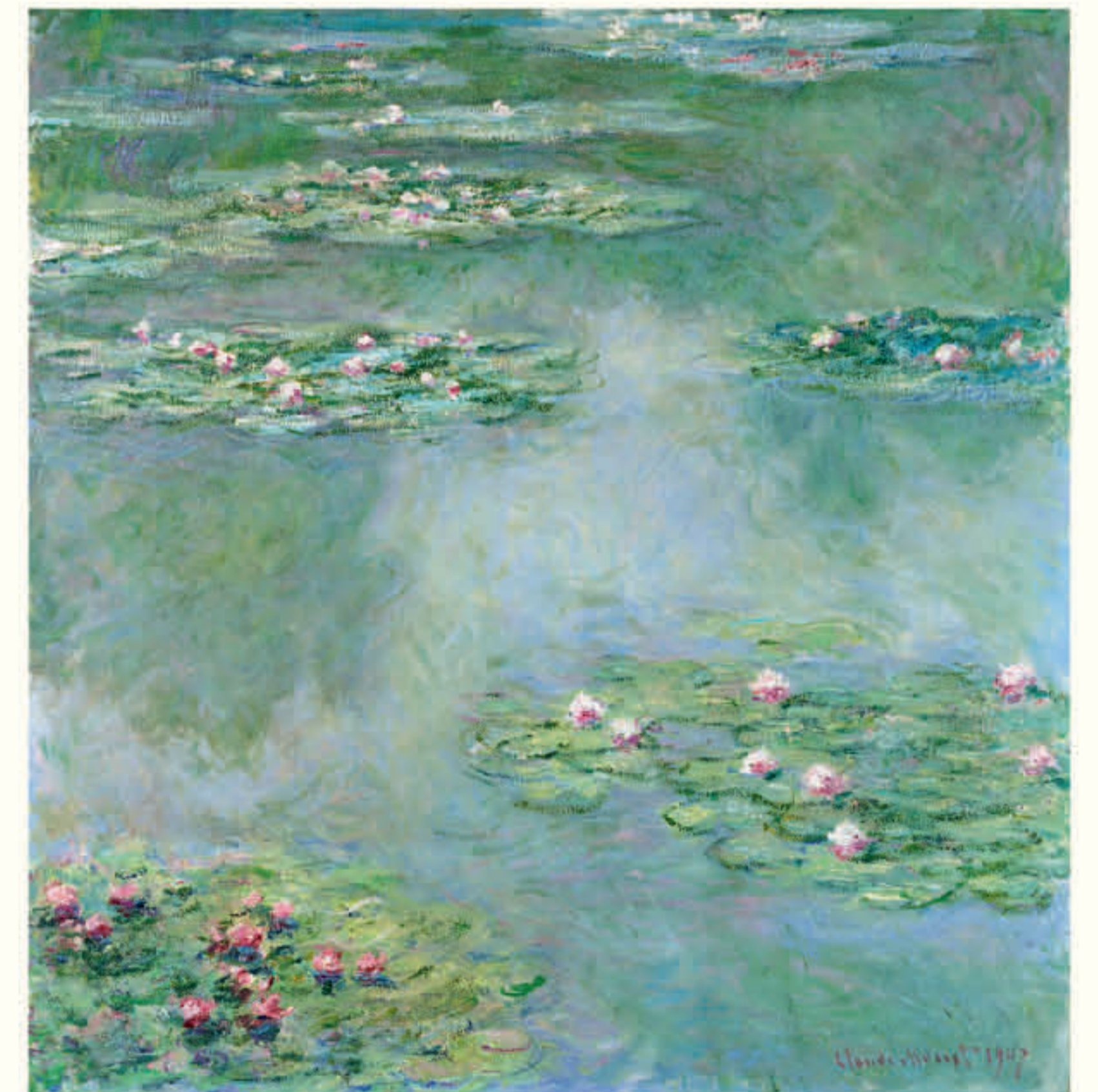
クロード・モネ《睡蓮》1907年