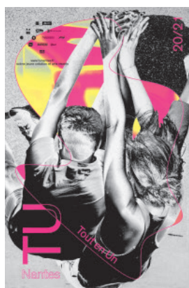
スーパーテラン(フランス) 〈あなたとナント市 シーズン2020-2021〉2020年 Super Terrain / Tu - Nantes, season 20/21