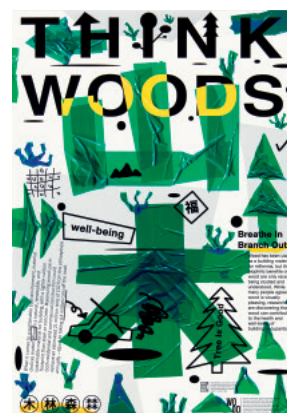
チェン・ヤンティン(台湾) 〈森を想う〉2020年 Chen Yanting / Think Woods