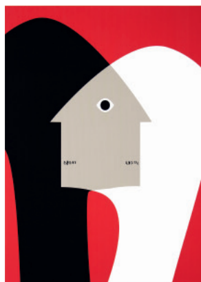
ヘ・ファン(中国) 〈一つになること〉2020年 He Huang / Unity

世界ポスタートリエンナーレトヤマ (IPT) は、世界から最新のポスターを公募し、審査・選抜する、日本で唯一の国際公募展です。1985年の創設以来、3年に1度のトリエンナーレ方式で開催を続けるなかで、現在では世界的に注目される公募展に数えられています。13回目を迎える公募には、世界64の国と地域より全部門総計5,943点のポスターが寄せられました。また、前回から設けた若手対象のデータ応募の部門を「U30+STUDENT部門」とし、公募対象を30才以上の学生まで広げました。本展では、全応募作品から選ばれた入選・受賞作品に、審査員による招待作品を加えた約400点により、世界の最先端をゆくポスターデザインを紹介します。