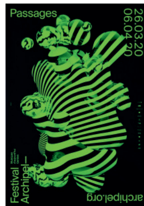
ソフィー・ルービン、セドリック・ロッセル(スイス) 〈フェスティバル・アルシペル2020年〉 Sophie Rubin, Cedric Rossel / Festival Archipel 2020