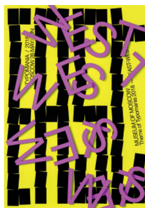
ヘシヤム・セイフ(エジプト) 〈東-西〉2018年 Hesham Seif / EAST-WEST