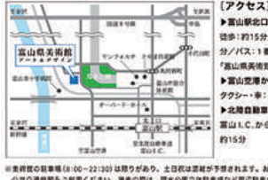
富山県美術館 Toyama Prefecture Museum of Art and Design

〒930-0806 富山県富山市木場町 3-20 3-20 Kiba-machi, Toyama City, Toyama, 930-0806, Japan TEL: 076-431-2711 / FAX: 076-431-2712 https://tdt-toyama.jp