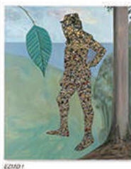
ZZZ07 1894 / 194×162 cm