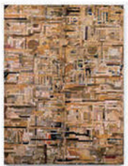
時鐘 | Time Memory-30 2018 / 203×150×10 cm