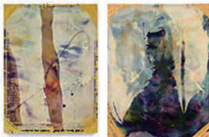
闘場 #1 (闘場) / Arena 1989-90 / 250×189.5×7.5 cm 個人蔵