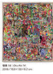
時鐘 14 | City of 14 2018 / 163×130×9.2 cm