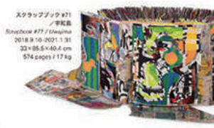
スタックブック #71 / 学園風 Stackbook #71 / Olympia 2018.8.9-2021.1.31 33×85.5×40.4 cm 574 pages / 17 kg