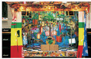
アップル・エッセイ / Apple-Note / New Chapter 1999 / 450×450×310 cm (stage) / 公財財団法人 現代美術館