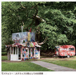
モンクロー / スカラップ(作風としての自由) MON CLOU: A Scar-Rappel as a Scenical Shelf 2012