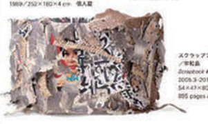
スタックブック #65 / 学園風 Stackbook #65 / Olympia 2009.3-2010.5.20 54×47×80 cm 899 pages / 29.9 kg