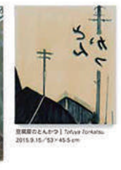
道徳のヒル / 道徳のヒル 2015.9.15 / 73×45.9 cm