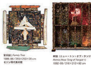
家族図 | Family Tree 1886.06 / 255×250×20 cm セゾン現代美術館