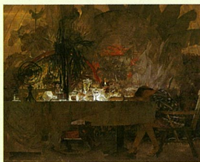
「旅の博物誌」 170×215cm 2012年 再興第97回院展日本美術院賞(大観賞)・天心記念茨城賞