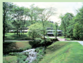
セゾン現代美術館外観

見る方に作品との対話を通して現代アートの愉しさを感じてもらう美術館。企画展「レイヤーズ・オブ・ネイチャー その線を越えて」では、日米で活躍するサムフランシス氏とその息子真吾フランシス氏、本邦初展示のクリスチャン・アヴァ氏(ベルリン)の作品を、翠緑の自然の中で堪能いただけます。