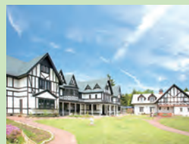
軽井沢ロンギングハウスレストラン外観

野菜ソムリエが厳選した野菜でおもてなしする評判のレストラン。コースランチは、採れたて野菜のサラダ、焼きたてパン、スープ、信州サーモン or 蓼科ポーク、デザート、コーヒー or ハーブティー。軽井沢の抜群のロケーションでお楽しみいただけます。