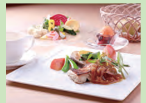
4皿コースランチ(イメージ)