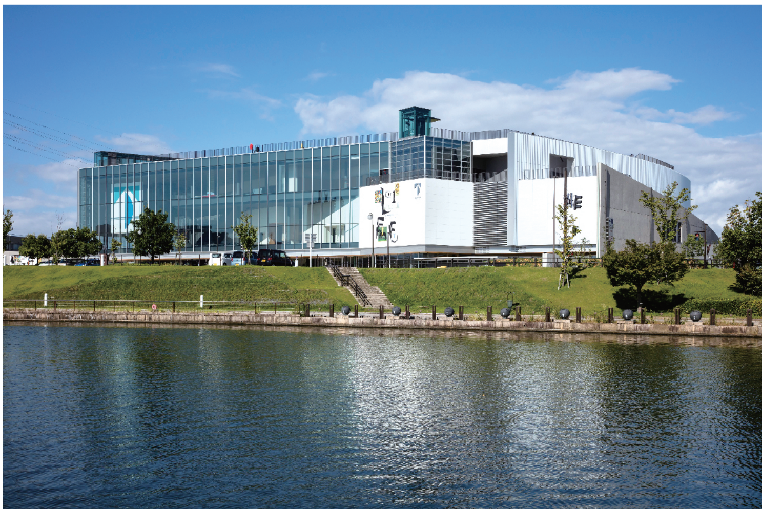
富山県美術館