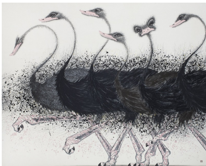
*「日本の美」展 出展作品 福井江太郎《晴》2014年 作家蔵

日時 2019年8月10日(土) 14:00～(約45分 開場13:30) 場所 富山県美術館 2階 ホワイエ (富山市木場町3-20 TEL 076-431-2711) 定員 椅子席50名(当日先着順、「日本の美」展の鑑賞券が必要です。)/立ち見可能 参加費 無料 内容 「日本の美」展出展作家の福井江太郎氏による墨絵の公開制作。 作品が生まれる迫力ある時間をご覧ください。