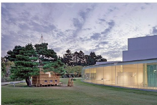
ブーフーウーの葉の家 東アジア文化都市2018金沢「変容する家」