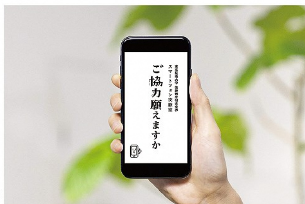
LINE映像コンテンツ「ご協力願えますか」