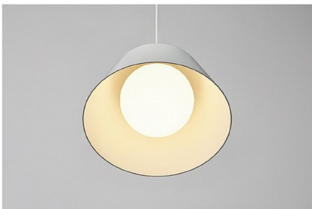
MUJI アクリルシェードライト