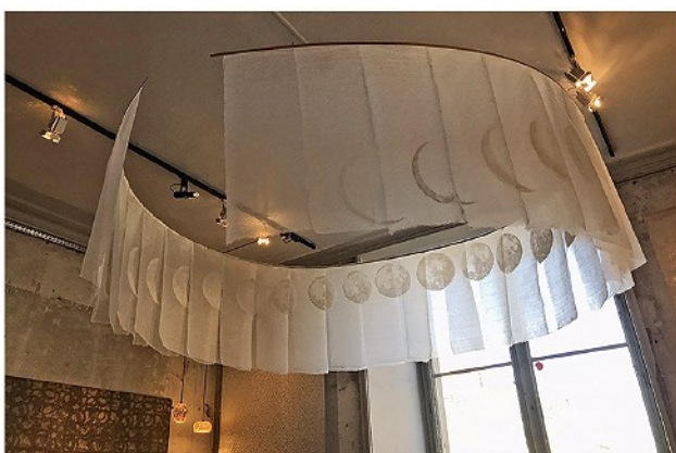
Parabola of Space