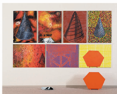
ジェニファー・バートレット《炎・テーブル・円錐G》1988-89年