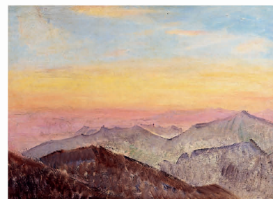
藤島武二《山上の日乃出》1934年