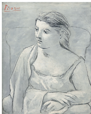
パブロ・ピカソ《肘かけ椅子の女》1923年

また本展では、収蔵作品の展示に プラス として、異なる分野で活躍する4名(開発好明氏、とに〜氏、林道郎氏、山内マリコ氏)にご協力をお願いした展示コーナーを設置します。美術と様々な関わり方をされる4名の視点を通して、作品の新たな見方・魅力をお楽しみください。