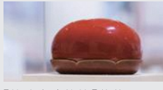
「乾漆朱塗飾箱『芍薬』」 小池 杏奈