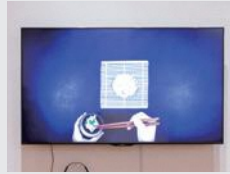
「氷見ウドンピック2020」 高橋 佳汰