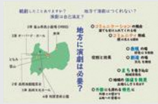
「地方における演劇の 役割と効果」(論文) 岡本 夏野