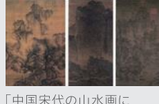
「中国宋代の山水画に おける『気』の表現」(論文) 中塚 美遥