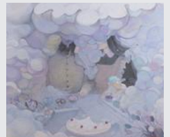
「いのちのいりぐち、 こころのでぐち」 稲場 美里