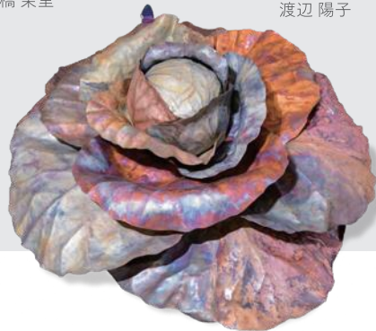
「Cabbage」 渡辺 陽子