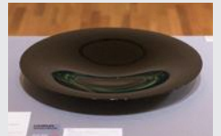
「乾漆呂色盛器」 水沢 卓生