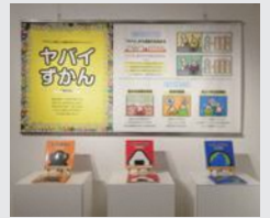
「ヤバイ図鑑」 谷口 太一