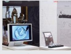
「レイノルズ指数を使った 新感覚スイーツの提案」 鍋谷 結衣