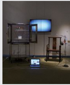
「#watercrisis」 芦田 麻都佳