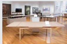
「エクステンション ダイニングテーブル」 栗井 咲佳