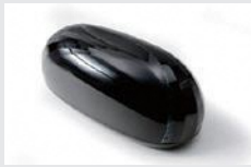
「乾漆箱『守』」 李 雨沢