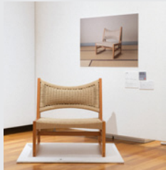
「とこ椅子」 宗重 隆之