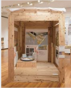
「災害時交流支援のための セルフビルドによる 仮設建築ユニットの提案」 高橋 沙綾