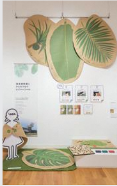
「水見市海浜植物園 リニューアルにおける サービスデザインの提案」 小木曾 文香