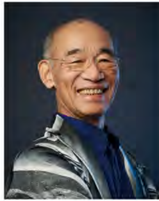
富野 由悠季 Tomino Yoshiyuki

アニメーション映画監督、脚本家、作詞家として様々な作品に係わった富野由悠季の、半世紀以上にわたる仕事を回顧する展覧会を開催します。本展では、「アニメーションは映画だ」という思いを軸に展開されてきた作品と制作のあゆみを、6つの章で紹介いたします。少年時代の創作、TVアニメーションの演出家としてデビューを果たした『鉄腕アトム』など初期作品から、昨年40周年を迎えた代表作『機動戦士ガンダム』シリーズや近年の監督作品まで、直筆の絵コンテ、仕事を共にしてきたクリエイターたちのデザイン画、資料など計約3000点を通して、その仕事の全容に迫ります。