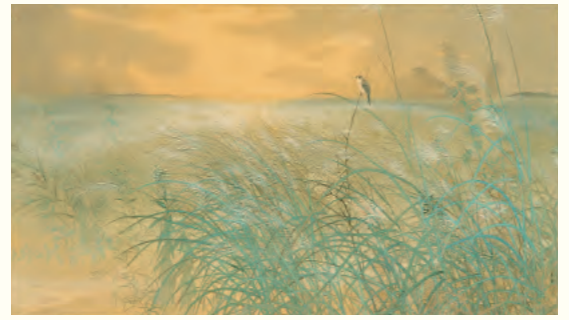
菱田春草《武蔵野》1898年