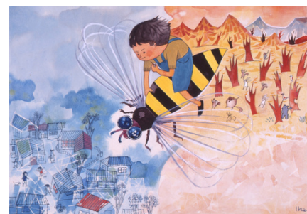
池田龍雄《ろくとちちのぼうけん》18-19頁 原画、 宮城県美術館蔵、1958年8月「こどものとも」29号掲載

本展には富山県美術館にも作品が所蔵されている、秋野不矩や池田龍雄、佐藤忠良といった画家、彫刻家も名を連ね、絵画や彫刻にとどまらない彼らの創作活動の一端に触れることのできる機会となります。これまで目にしてきた作品とは異なる作家の一面と出会うことができるでしょう。