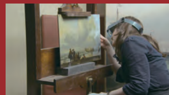
© 2014 Gallery Film LLC and Ideale Audience. All Rights Reserved.

ロンドンの中心、トラファルガー広場に位置するナショナル・ギャラリー。英国の小さな美術館が190年間人々に愛され続ける理由とは? 額縁の制作風景、作品の修復作業など普段見ることのできない舞台裏を映し出す。『ニューヨーク公共図書館』、『ボストン市庁舎』などを手掛けるドキュメンタリー映画の巨匠、フレデリック・ワイズマン監督作品。