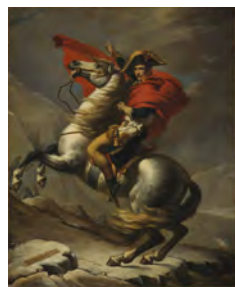
ジャック＝ルイ・ダヴィッドの工房 《サン＝ベルナル峠を越えるボナパルト》 東京富士美術館蔵