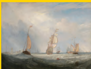
ジョセフ・マロード・ウィリアム・ターナー 《ヘレヴーツリュイスから出航するユトレヒトシティ64号》1832年 東京富士美術館蔵