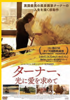
© Channel Four Television Corporation, The British Film Institute, Diaphana, France3 Cinéma, Untitled 13 Commissioning Ltd 2014.

19世紀イギリス最大の風景画家、ターナー。産業革命から都市の近代化が進む時代に、大気と光の表現を追求した。本作では、ターナーの創作の秘密を紐解きながら、彼が旅した風景、光溢れる美の世界へと誘う。東京富士美術館コレクション展出品作品の《ヘレヴーツリュイスから出航するユトレヒトシティ64号》にまつわる「事件」についても紹介。