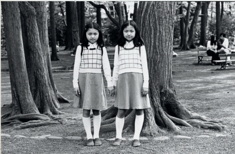
牛腸茂雄 (SELF AND OTHERS) 1977年 新潟県立近代美術館・万代島美術館蔵 前期のみ展示

The Spirit of Avant-Garde Photography: Transforming "Nothing Much" -TAKIGUCHI Shuzo, ABE Nobuya, OTSUJI Kiyoji, GOCHO Shigeo