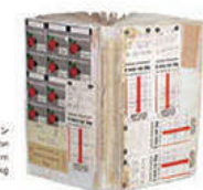
スタックブック #1 / ロンドン Stackbook #1 / London 1977-78 / 5×13.2×3.8 cm 196 pages / 0.4 kg