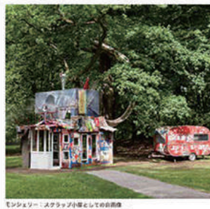
モンクロー / スカラップ(斗風)としての自由 MON CLOUTIER: A Scar-App as a Scanned Sheet 2012