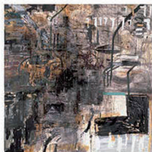
シロウチヘ | Arena I 1984 / 190×185 cm