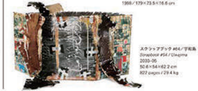
スタックブック #64 / 斗風 Stackbook #64 / Dementia 2009-10 50.6×54×6.2 cm 492 pages / 29.4 kg

【アクセス】 富山駅前北口から 徒歩: 約15分 / タクシー: 約3分 / バス: 1番のりばより乗車 「富山美術館」下車すぐ 富山駅から タクシー: 約20分 (約9km) 北陸自動車道 41号線由 約15分