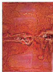
闘場 / 本陣風 | Arena / Silver Wind I 1999-2020 / 230×130×10 cm