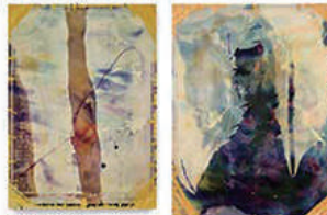
闘場 #1 (斗風) Arena #1 (Shiro Uchihe) 1988-90 / 250×189.5×7.5 cm 個人蔵