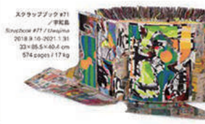
スタックブック #71 斗風 Stackbook #71 / Dementia 2018.8.9-2021.1.31 33×85.5×40.4 cm 574 pages / 17 kg