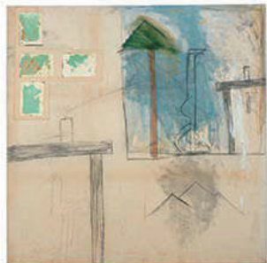
4つの椅子 | Four Chairs 1984 / 162×162 cm