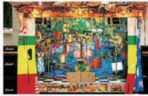
アップル / シェン / 斗風 Apple / Shen / Bunk 1999 / 450×450×310 cm (stage) / 公財財団法人 現代美術館