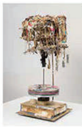
時鐘 / フォードバック Time Memory / Feedback 2015 / 42×42×36 cm