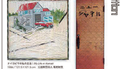
ニュー / シェン / 斗風 New Chart 1999 / 139×73.5×16.6 cm