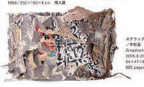
スタックブック #65 斗風 Stackbook #65 / Dementia 2009.3-2010.5.20 54×47×8.0 cm 495 pages / 29.9 kg