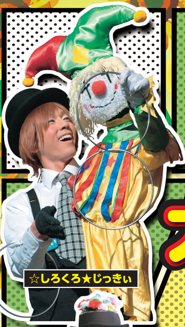
☆しろくろ☆じつきい