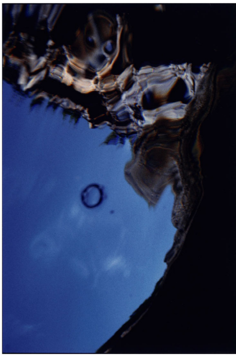
東野芳明《水の肌・2 (サンタモニカ、サム・フランス邸)》 1987年 富山県美術館蔵