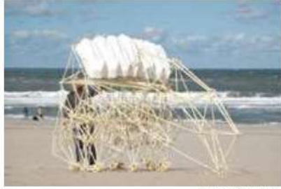
Animaris Ordis (2006)