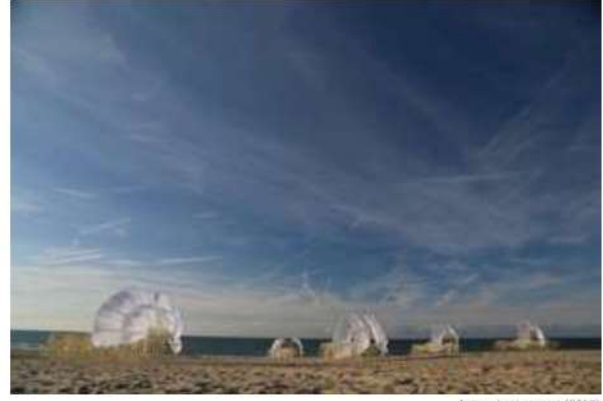
Animaris Uminami (2017)