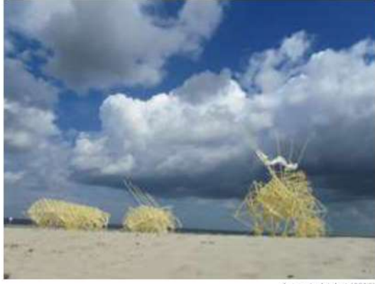
Animaris Adulari (2012)